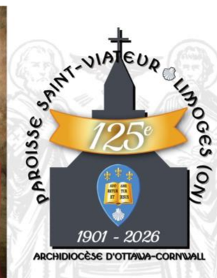
Commencement des festivités du 125 e anniversaire de la Paroisse Saint-Viateur